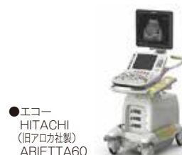
●エコー HITACHI (旧アロカ社製) ARIETTA60